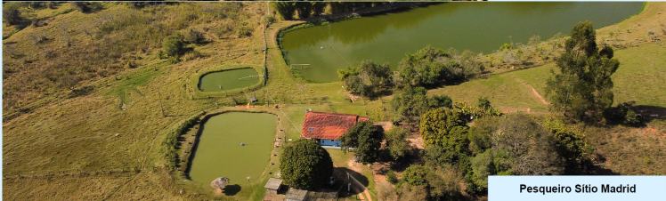
Pesqueiro Sítio Madrid