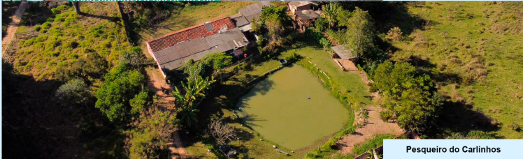
Pesqueiro do Carlinhos