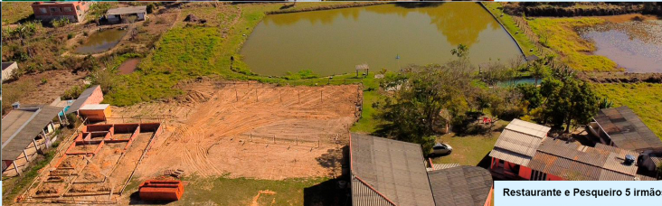
Restaurante e Pesqueiro 5 Irmãos