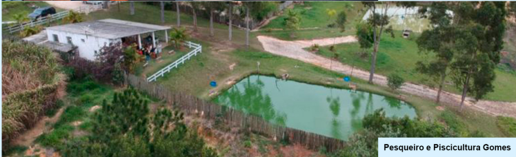
Pesqueiro e Piscicultura Gomes