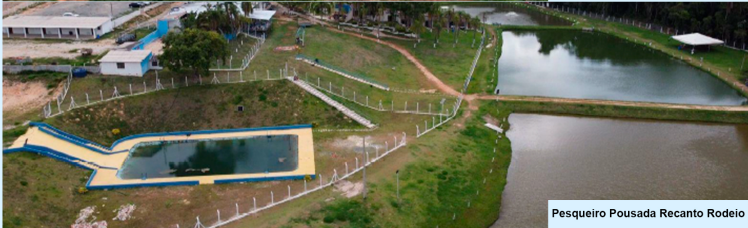
Pesqueiro Pousada Recanto Rodeio