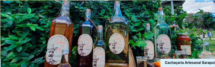
Cachaçaria Artesanal Sarapuí