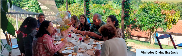
Vinhedos Divina Essência